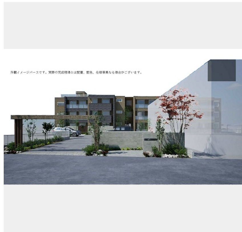
外観イメージベースです。実際の完成現場とは配置、配色、仕様等異なる場合がございます。