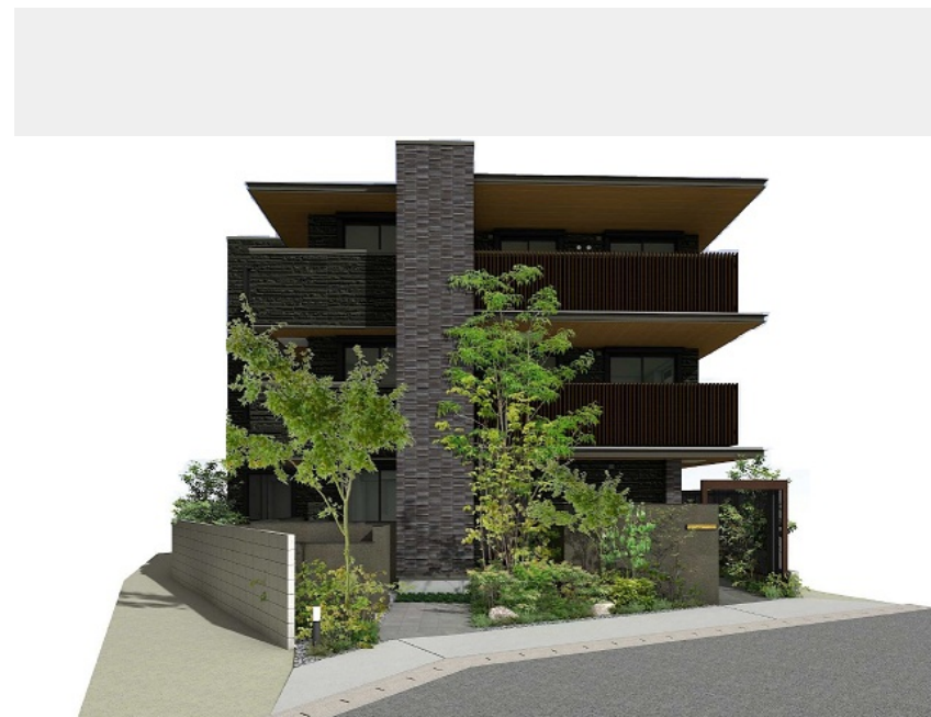
外観イメージベースです。実際の完成現場とは配置、配色、仕様等変更になる場合がございます。