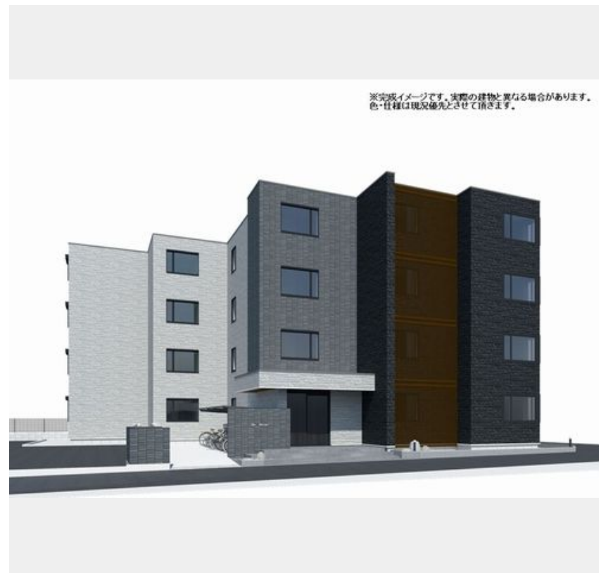
※完成イメージです。実際の建物と異なる場合があります。色・仕様は現況優先とさせていただきます。