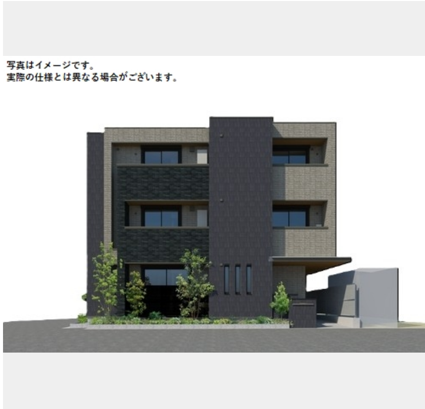
写真はイメージです。実際の仕様とは異なる場合がございます。