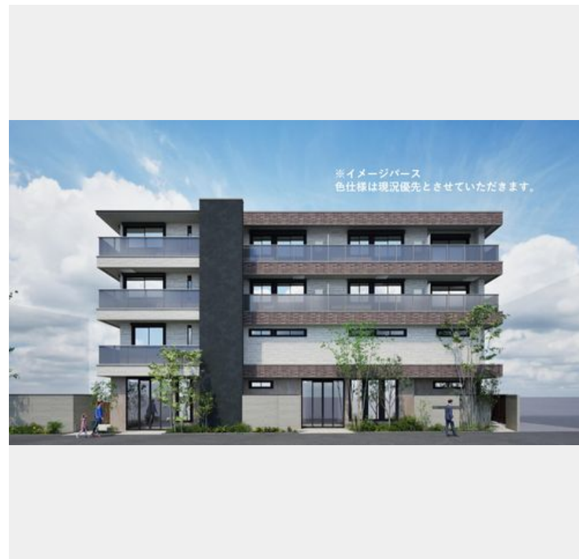
※イメージパース 色仕様は現況優先とさせていただきます。