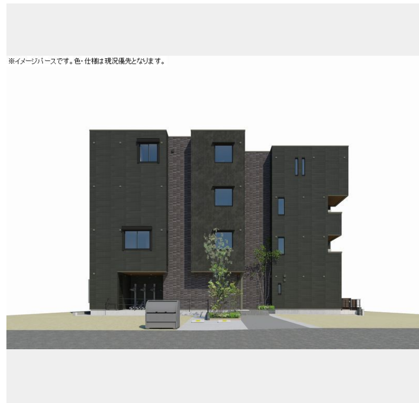
※イメージバースです。色・仕様は現況優先となります。