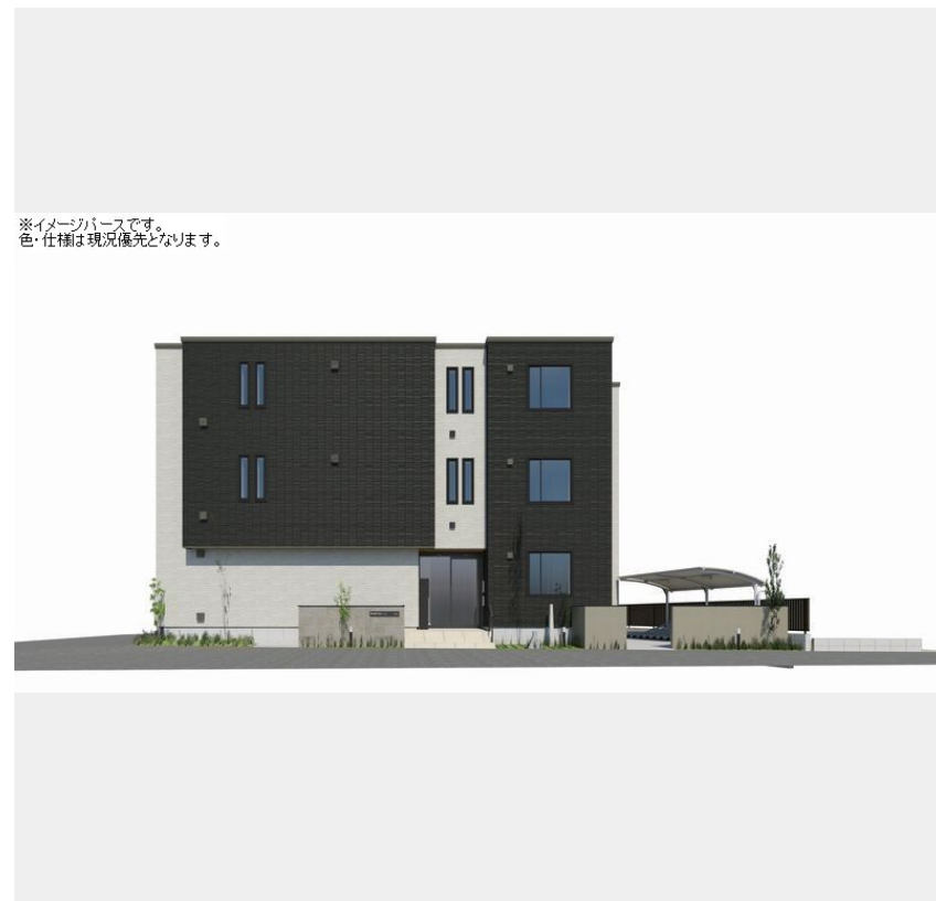
※イメージハウスです。色・仕様が現況優先となります。