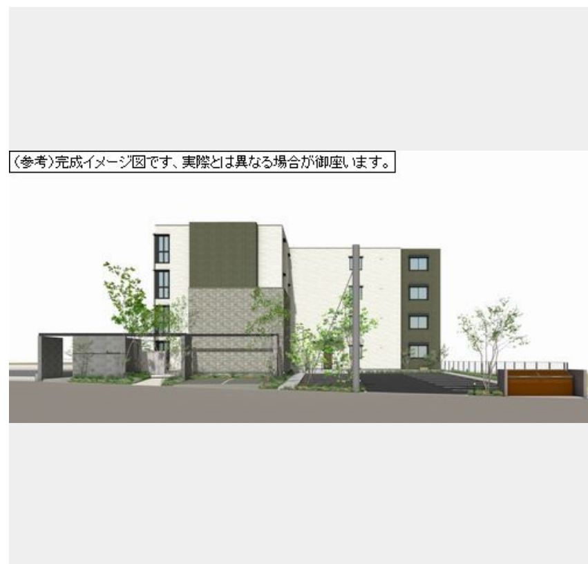
(参考)完成イメージ図です、実際とは異なる場合がございます。