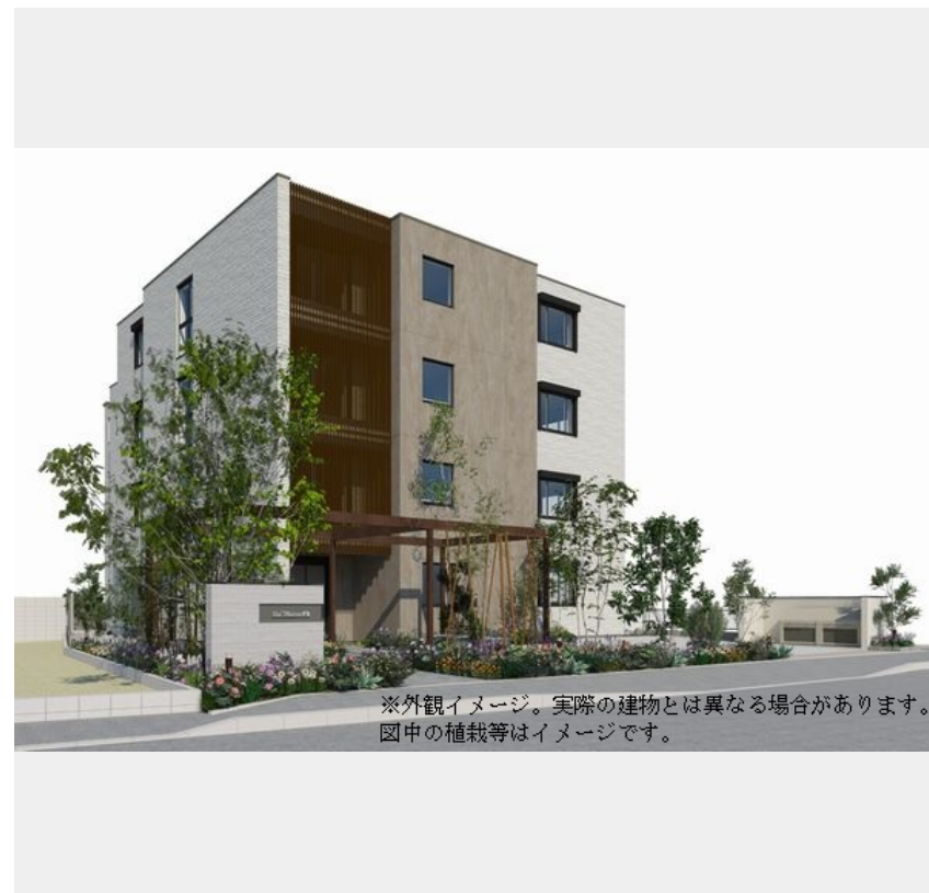
※外観イメージ。実際の建物とは異なる場合があります。図中の植栽等はイメージです。