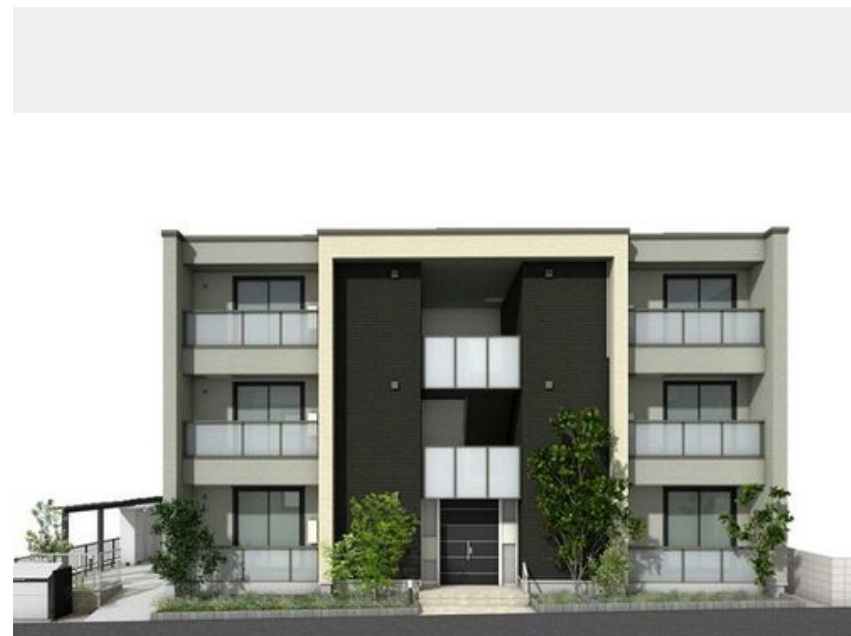
イメージバースとなります。実際とは異なります。