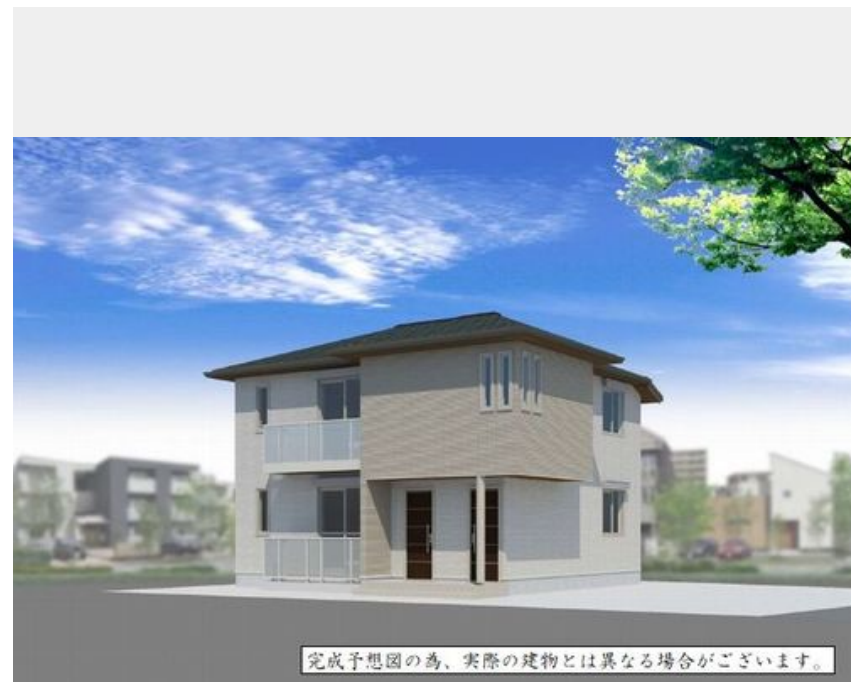
完成予想図の為、実際の建物とは異なる場合がございます。