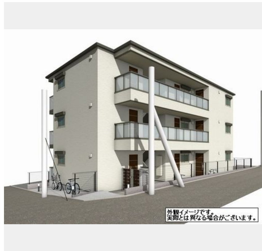
外観イメージです。実際とは異なる場合がございます。