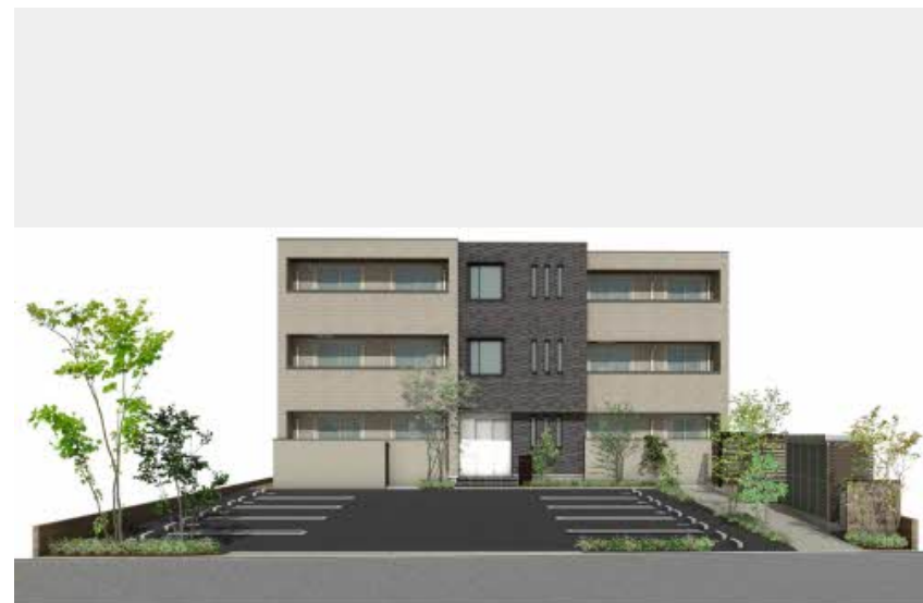
※写真は完成予想図です パースは実際の図面をもとに描き起こしたイメージで、実際のものとは異なる場合があります