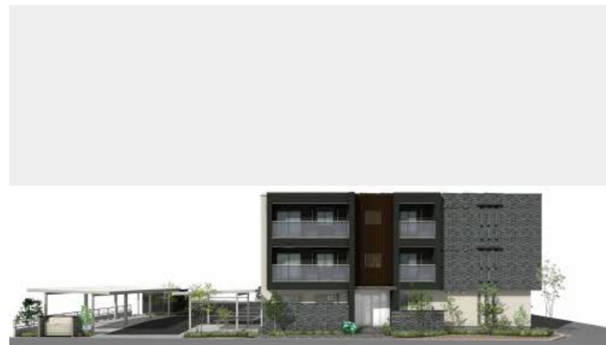
※写真は完成予想図です パースは実際の図面をもとに描き起こしたイメージで、実際のものとは異なる場合があります