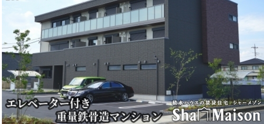
エレベーター付き 重量鉄骨造マンション Sha Maison