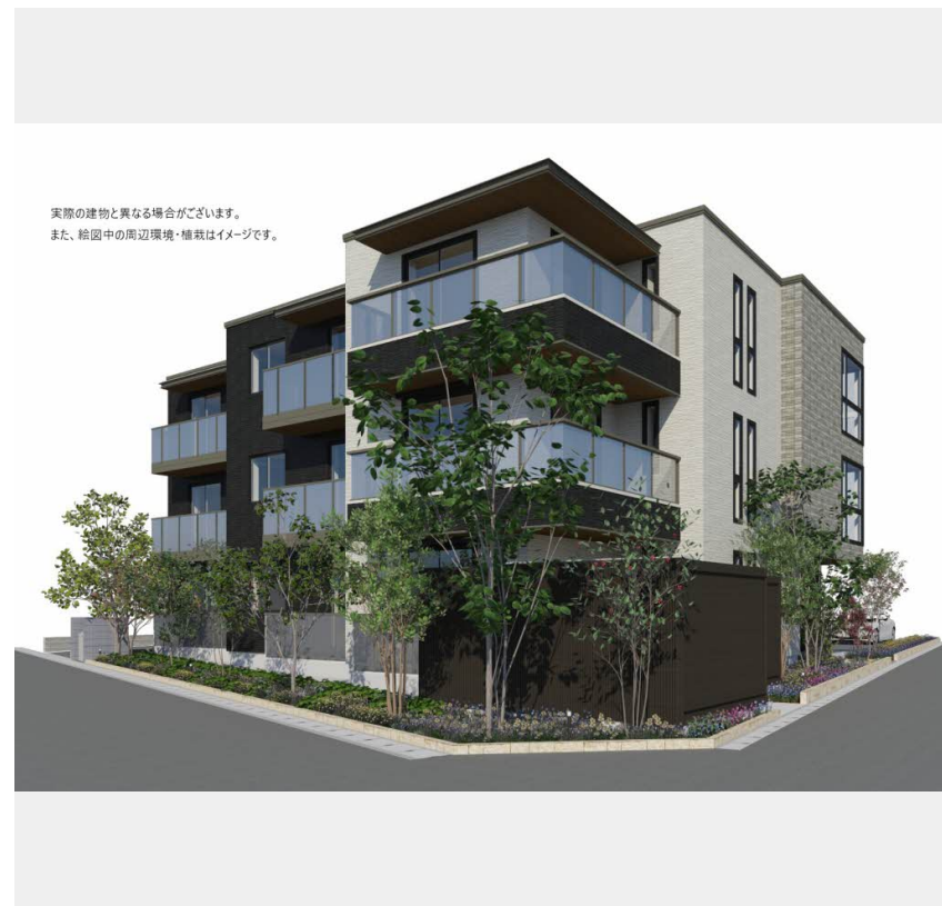
実際の建物と異なる場合がございます。 また、絵図中の周辺環境・植栽はイメージです。