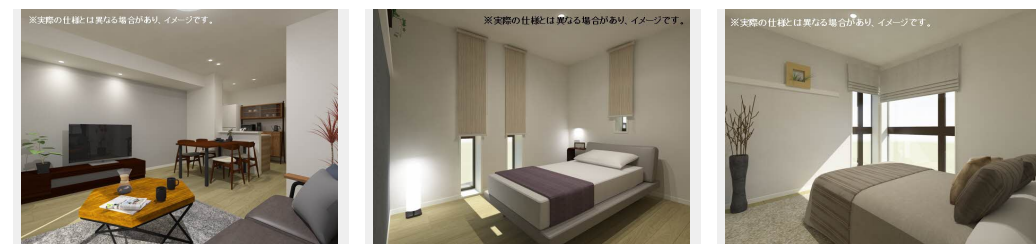
※実際の仕様に異なる場合があります。イメージです。