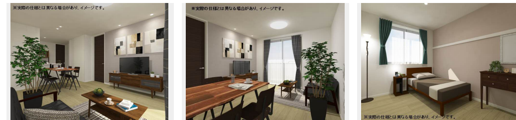
※実際の仕様が異なる場合がございます。イメージです。