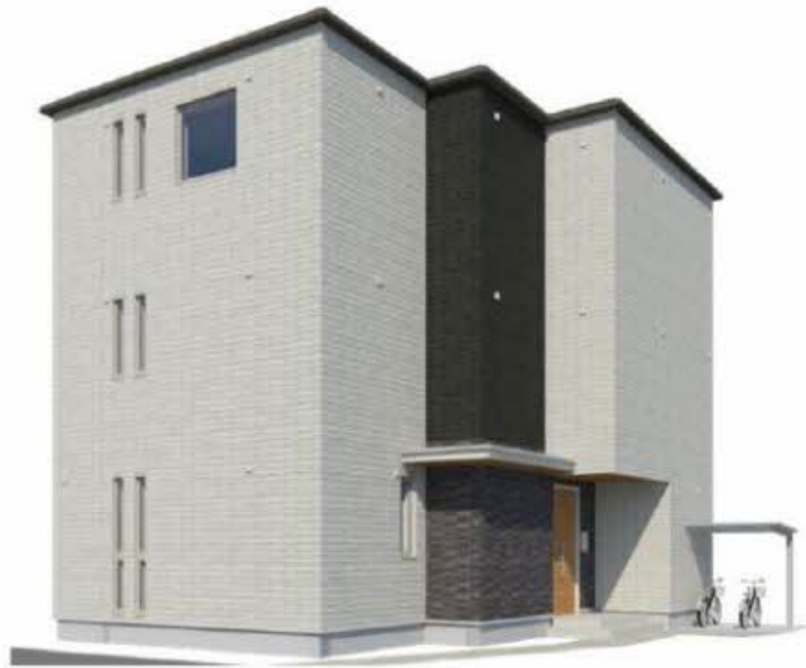
【完成予想図】実際の建物と異なる場合がございます。また、絵図中の周辺環境・植栽はイメージです。