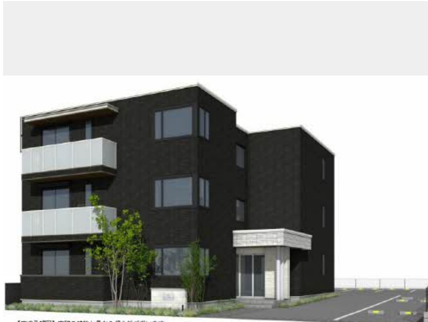
【完成予想図】実際の建物と異なる場合がございます。また、絵图中的周辺環境・植栽イメージです。