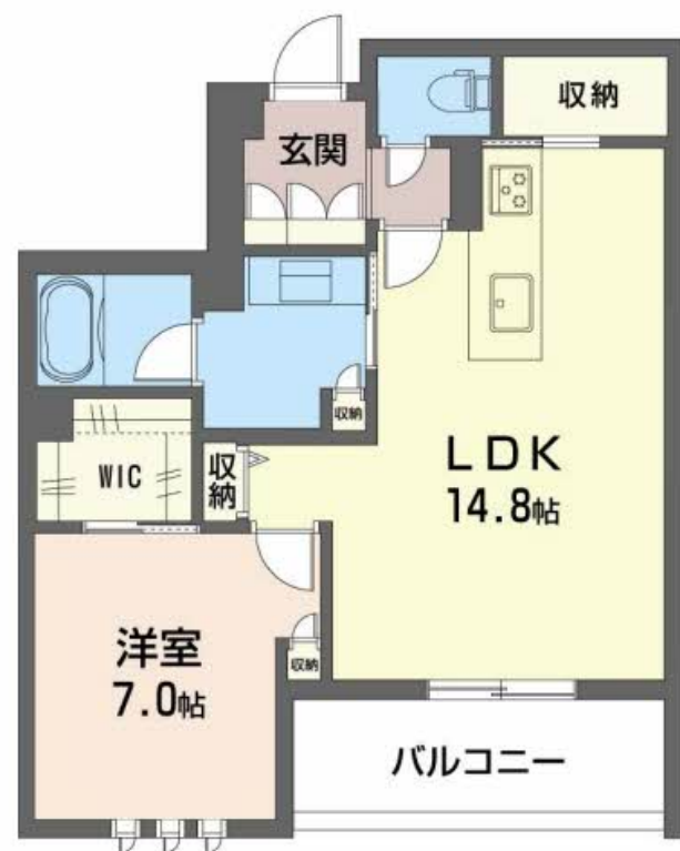
積水ハウスの賃貸住宅 シャーメゾン