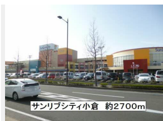
サンリアシティ小倉 約2700m