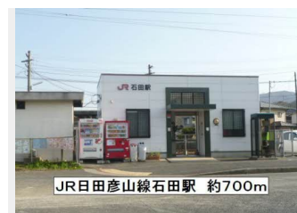
JR日田彦山線石田駅 約700m