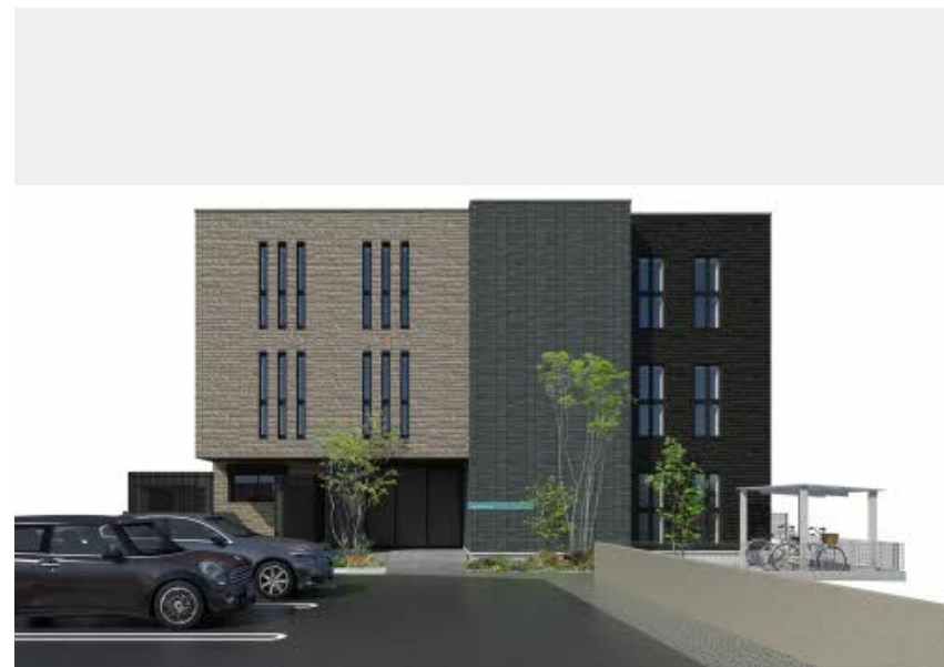
※写真はイメージです パースは実際の図面をもとに描き起こしたイメージで、実際のものとは異なる場合があります