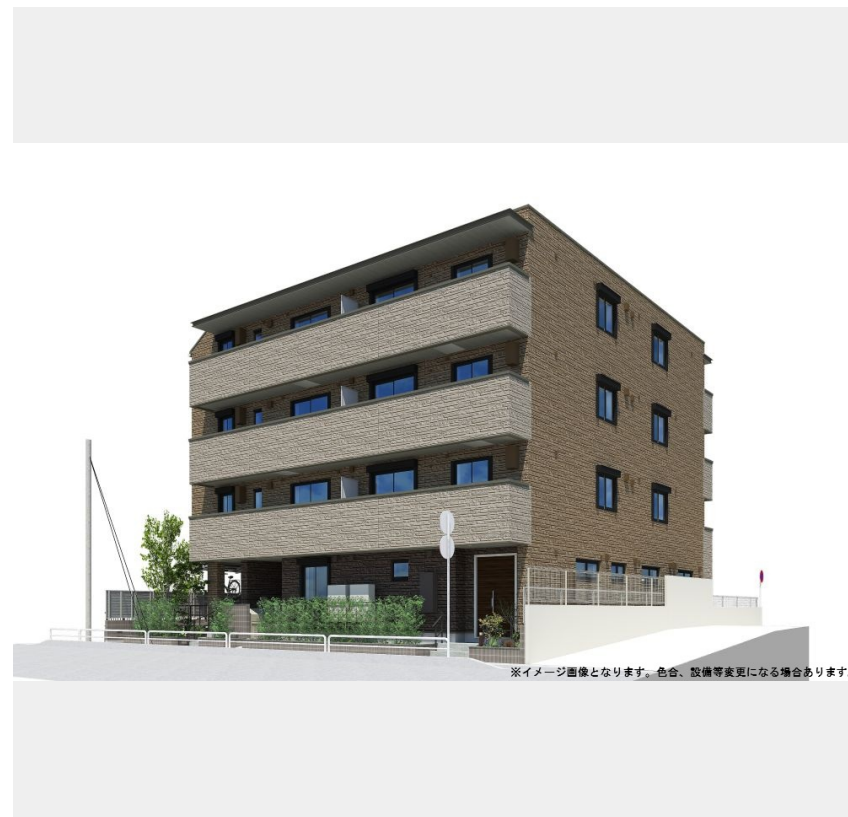
※イメージ画像となります。色合、設備等変更になる場合があります。