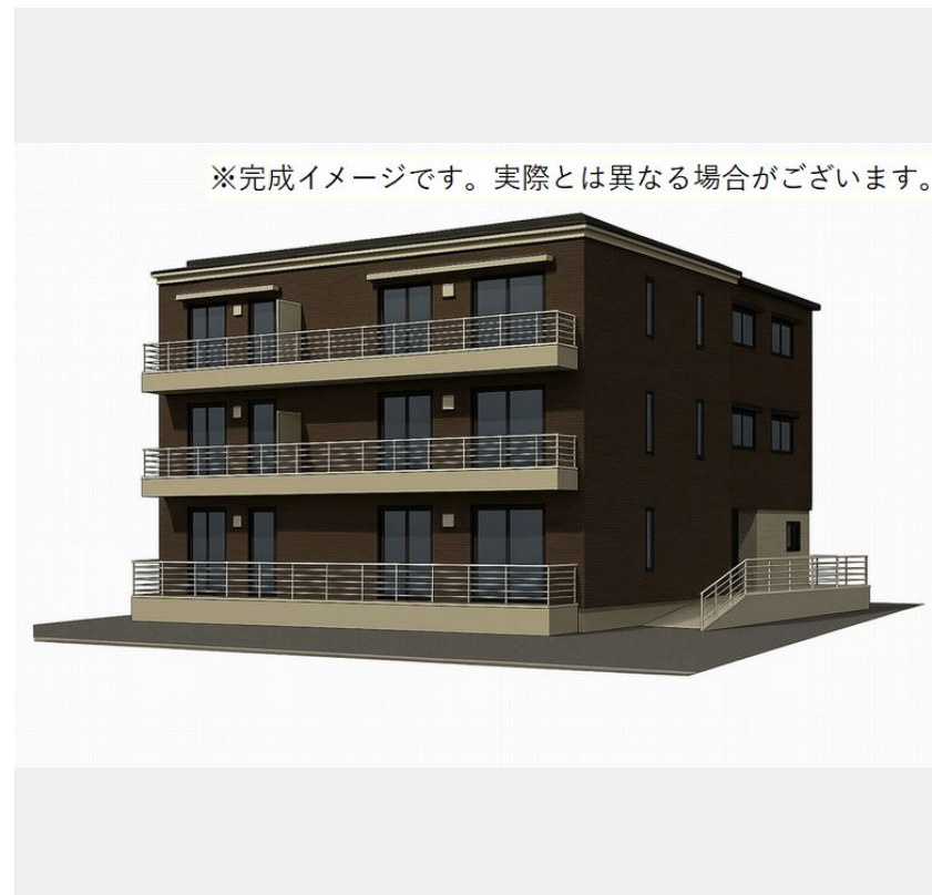
※完成イメージです。実際とは異なる場合がございます。