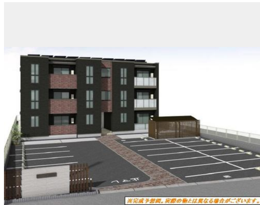
※完成予想図。実際の物とは異なる場合がございます。