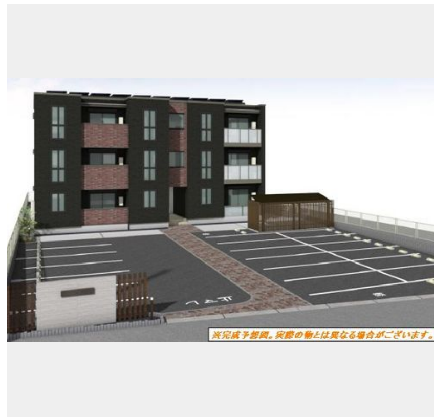
※完成予想図。実際の物とは異なる場合がございます。