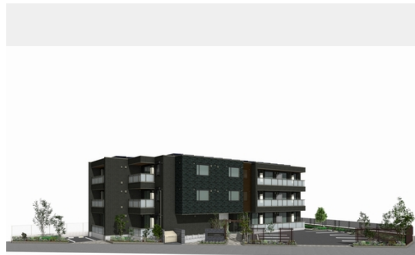
※イメージになります。実際とは異なる場合がございます。