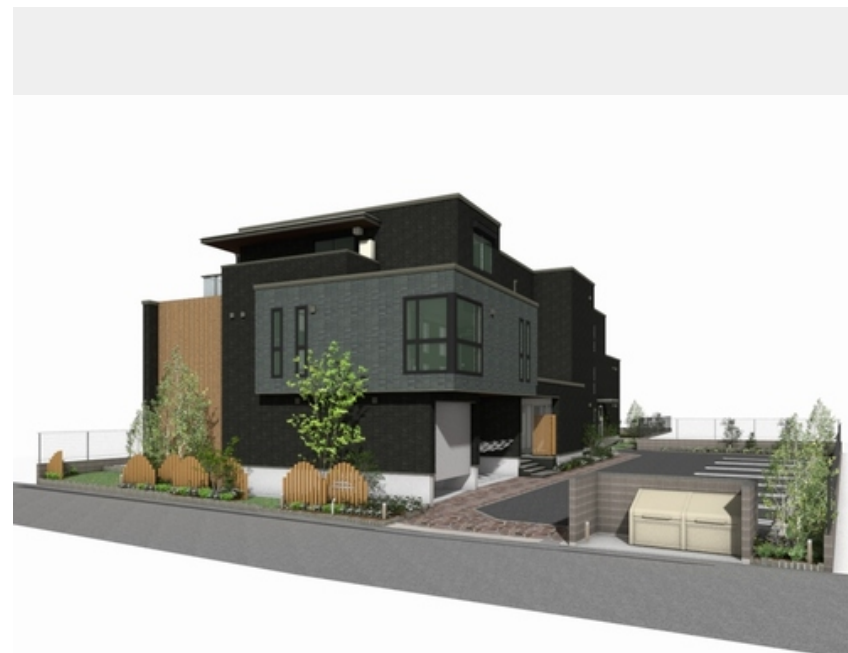
※イメージになります。実際とは異なる場合がございます。