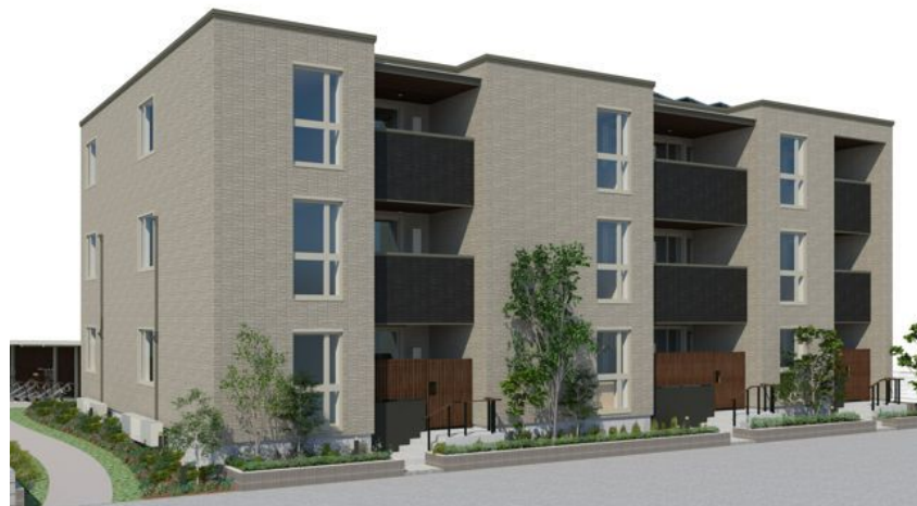
【完成予想図】2026年7月末完成予定