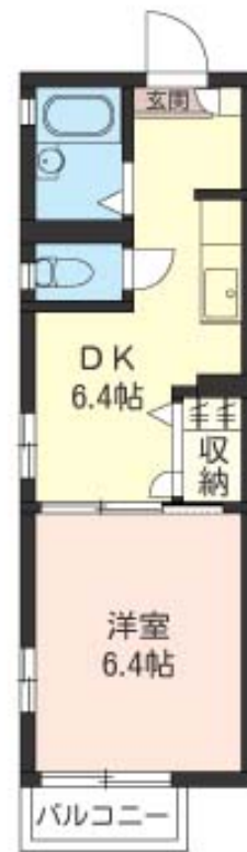
積水ハウスの賃貸住宅 シャーメゾン