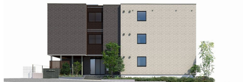
※完成イメージです。実際とは異なる場合がございます。