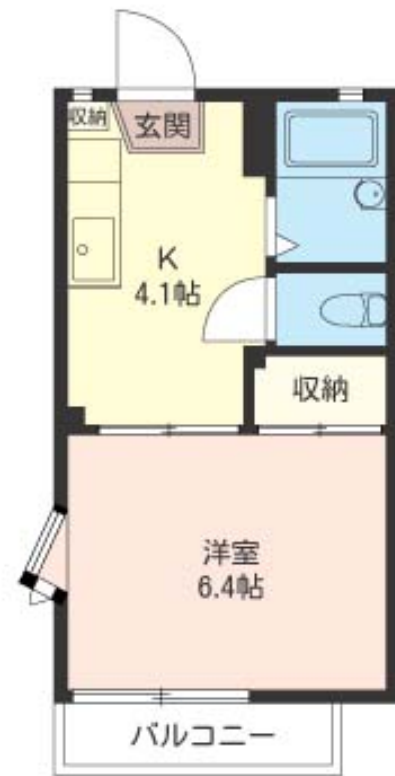
積水ハウスの賃貸住宅 シャーメゾン