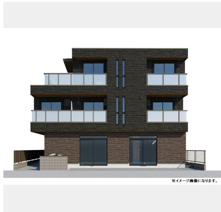
※イメージ画像になります。