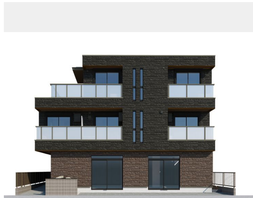
※イメージ画像になります。