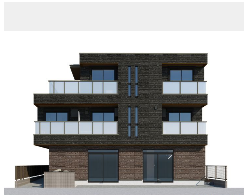
※イメージ画像になります。