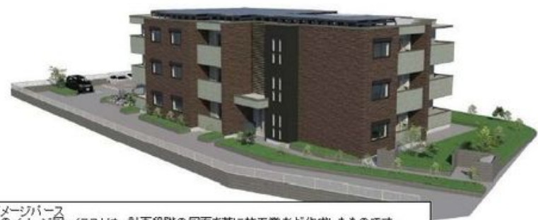
イメージパース このイメージ図・イラストは、計画段階の図面を基に施工業者が作成したものです。 設計施工上の理由などにより変更となる場合があります。変更の場合は現状有姿とします。