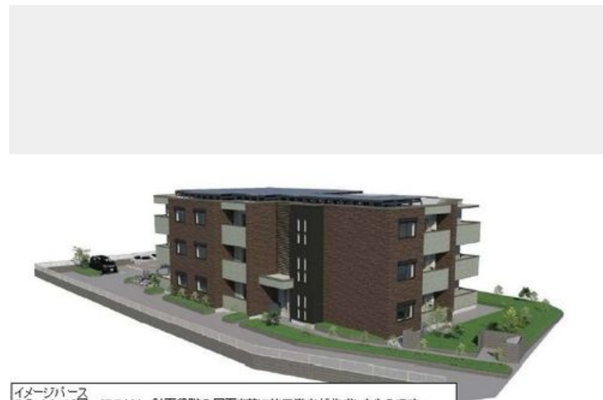
イメージパース このイメージイラストは、計画段階の図面を基に施工業者が作成したものです。 設計施工上の理由などにより変更となる場合があります。変更の場合は現状有姿とします。