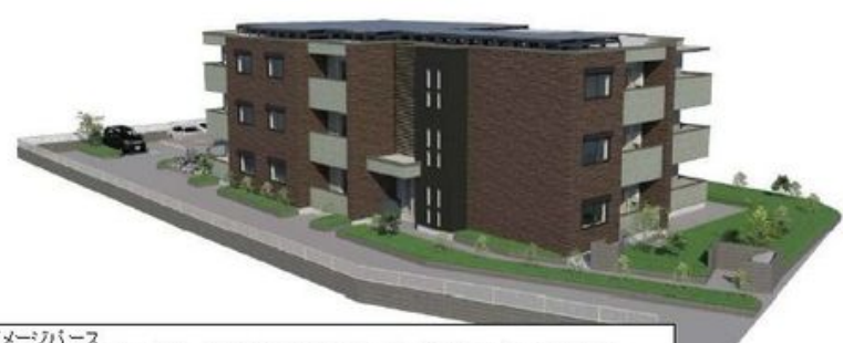
イメージパース このイメージ図・イラストは、計画段階の図面を基に施工業者が作成したものです。 設計施工上の理由などにより変更となる場合があります。変更の場合は現状有姿とします。