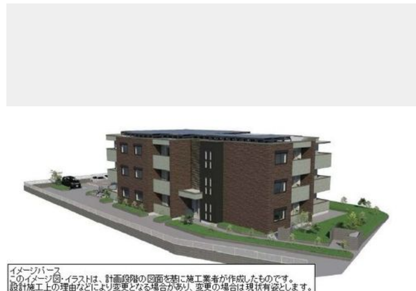
イメージパース このイメージイラストは、計画段階の図面を基に施工業者が作成したものです。 設計施工上の理由などにより変更となる場合があります。変更の場合は現状有姿とします。