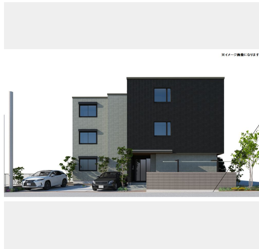
※イメージ画像になります。