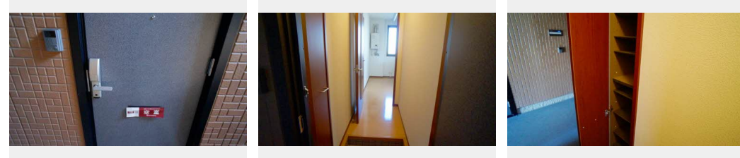
積水ハウスの賃貸住宅 シャーメゾン