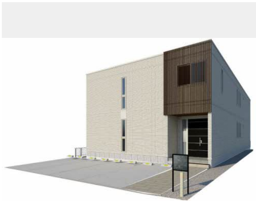
【完成予想図】実際の建物と異なる場合がございます。