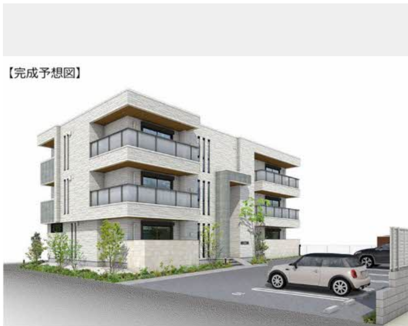
パースは回覧も参考にしてください。実際のものと異なる場合があります。