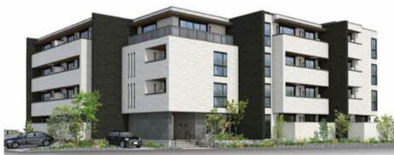
パースは図案を基に描かれたイメージで、実際のものとなる場合があります。