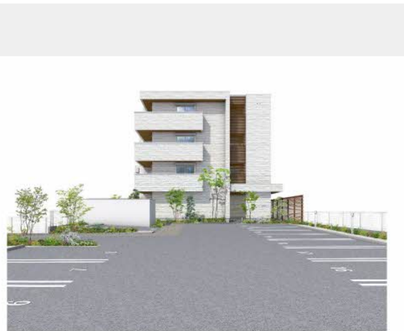
パースは図面を基に焼き起こしたイメージで、実際のものとは異なる場合があります。