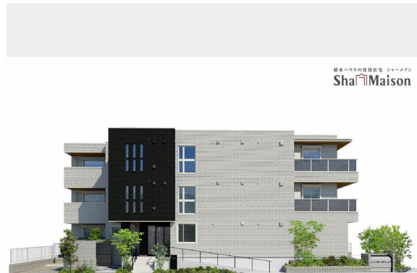
積水ハウスの賃貸住宅 シャーメゾン Sha Maison