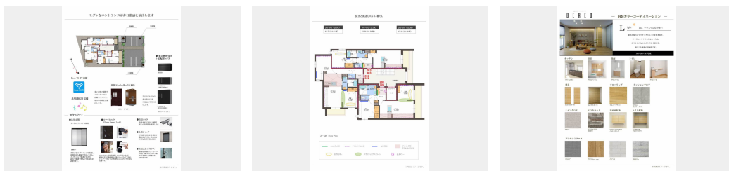
積水ハウスの賃貸住宅 シャーメゾン