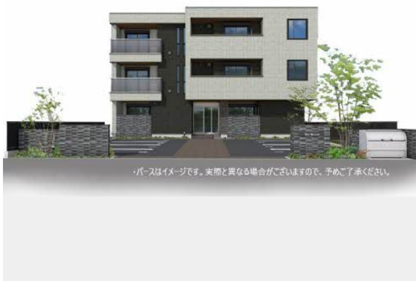
・パースはイメージです。実際と異なる場合がございますので、予めご了承ください。