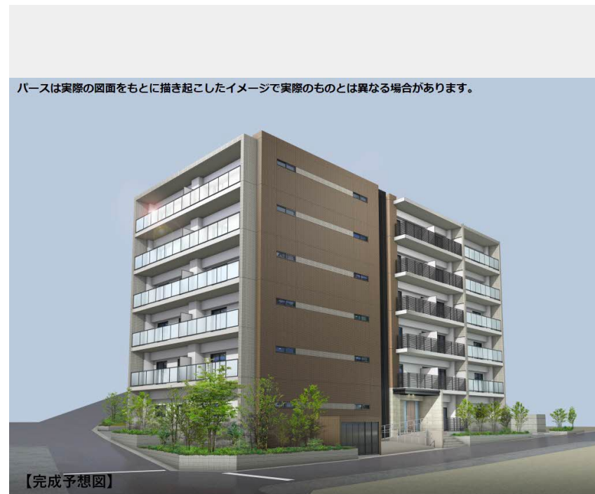
パースは実際の図面をもとに描き起こしたイメージで実際のものとは異なる場合があります。