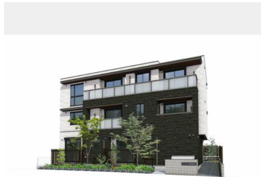
・パースはイメージです。・実際と異なる場合がございます。